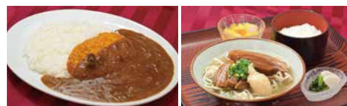
カツカレー 1,000円(税別)