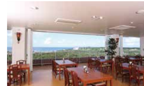
レストラン「プラシヤンテ」

東シナ海を一望できる、オープンテラスのレストランから、宴会場まで多彩なニーズにお応えいたします。