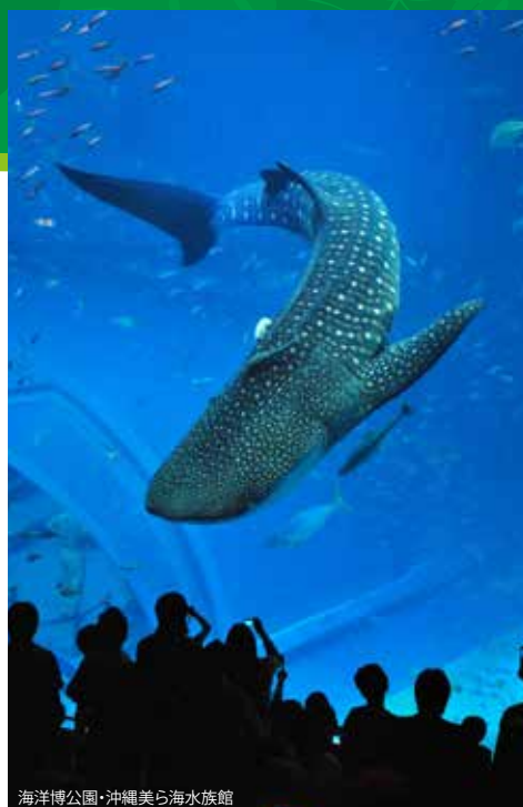
海洋博公園・沖縄美ら海水族館

琉球三山時代の北山王の居城後で、首里城と同等の面積を誇る沖縄屈指の名城。標高100mの城跡からは、国頭の山並や伊平屋・伊是名の島々、遠くと論島の景色が一望できます。