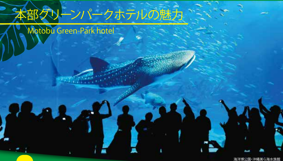
海洋博公園・沖縄美ら海水族館